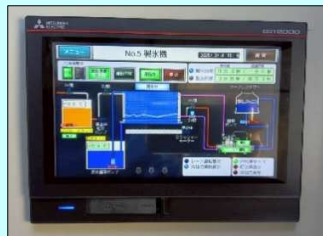
【←タッチパネルにて運転状況確認】