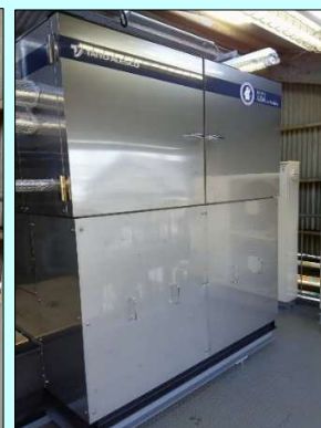
【AIM製氷機ユニット(屋内設置)↑】