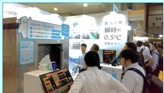
👉 デモ機にて0.5℃冷水を体感頂きました