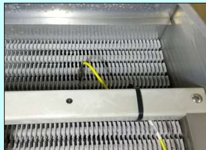
<コイル温度センサ取付>