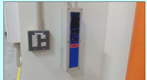
【監禁警報 コンボディスプレイ】