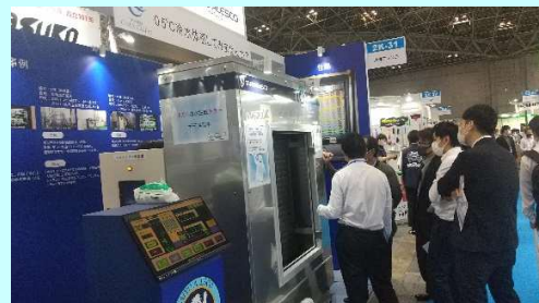
【OMAチラー】(写真はフードファクトリー2023出展時)