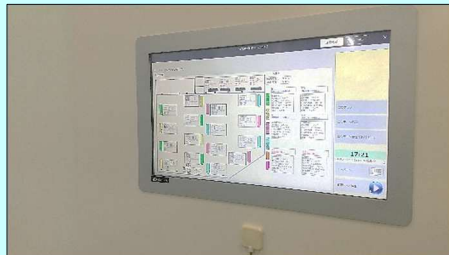
【AM'S+a タッチパネルディスプレイ】