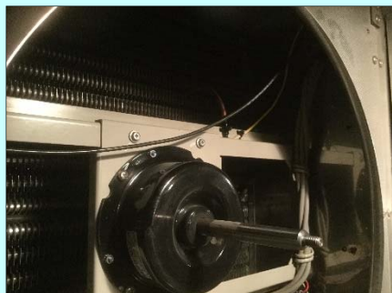
コイル温度センサ取付